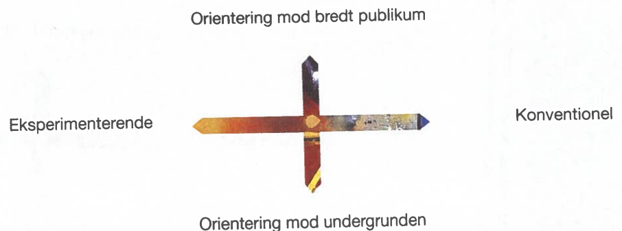
Figur 3. Spændingsfelter i dansk rap

De to spændingsfelter kan integreres som to akser i et koordinatsystem (se figur 3). I denne model kan man placere en rapper/rapgruppe eller et rapudsagn ud fra graden af eksperiment eller konvention samt retningen mod bredt publikum eller undergrunden.