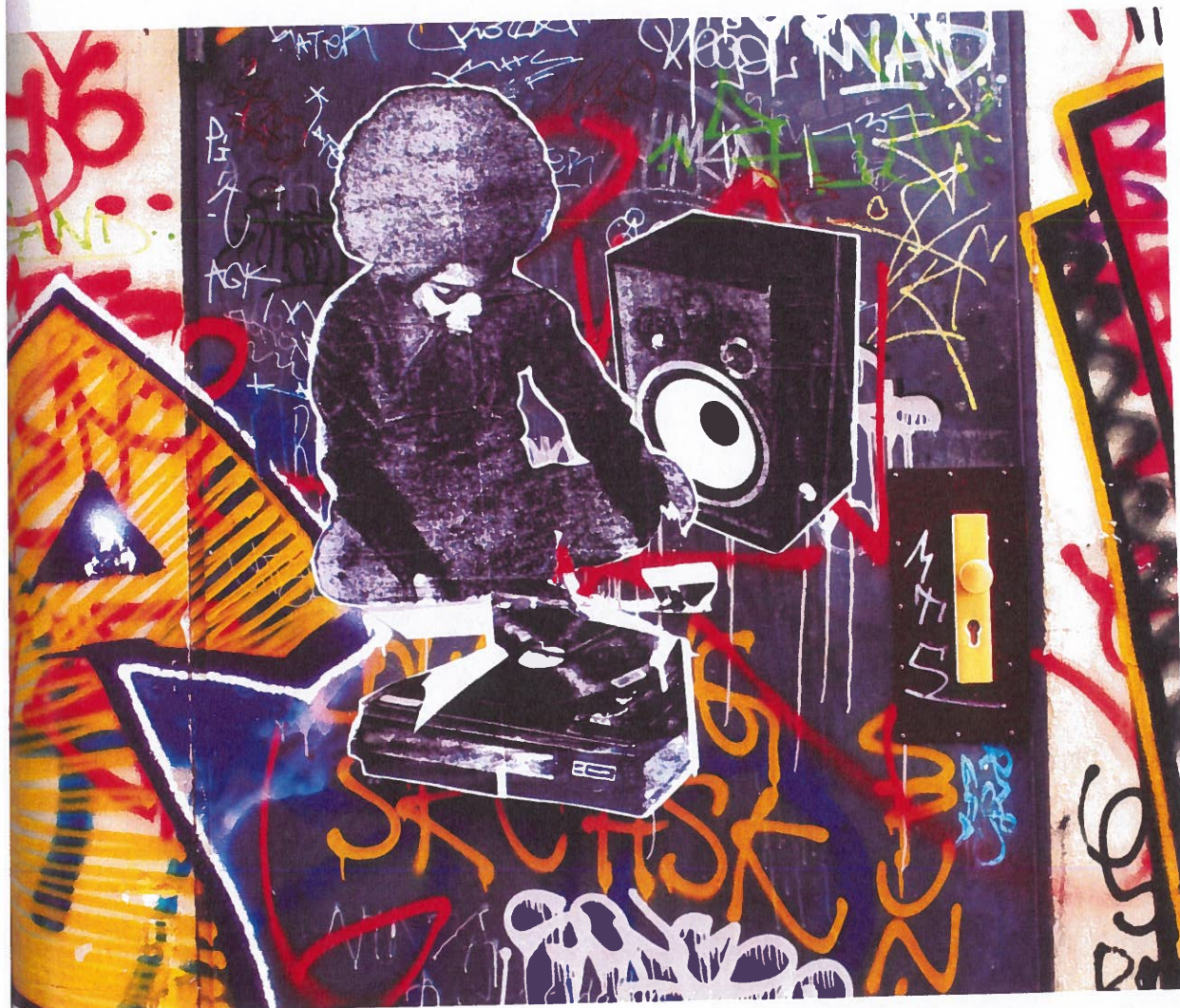
Illustration 11. Graffitimur, Berlin 2009

Bemærk, hvor komplekse rimstrukturerne er, og hvor mange forskellige former for rim teksten er proppet med. Den er et godt eksempel på de store litterære kvaliteter, man kan finde i rapudsagn.