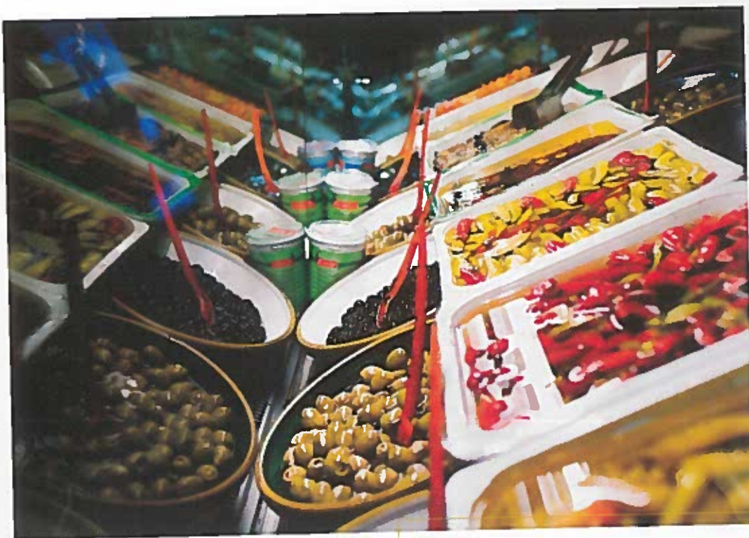
Integration handler også om mad.

diskussion om, hvor langt majoriteten skal strække sig i bestræbelserne på at komme minoritetens ønsker i møde. Skal forældre og pædagoger i en børnehave tage hensyn til, at der kan være muslimske børn på stuerne, således at børn f.eks. ikke kan have pølsehorn lavet af svinekød med til uddeling i forbindelse med en fødselsdag?