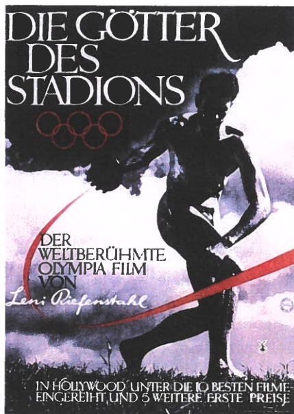
Filmplakat til Leni Riefenstahls dokumentar- og propagandafilm Olympia fra 1936.

Leni Riefenstahl er også kendt for Olympia (1938), som er en iscenesættelse af de Olympiske Lege i 1936 i Berlin, hvor der blandt andet blev introduceret slow motion-teknikker.