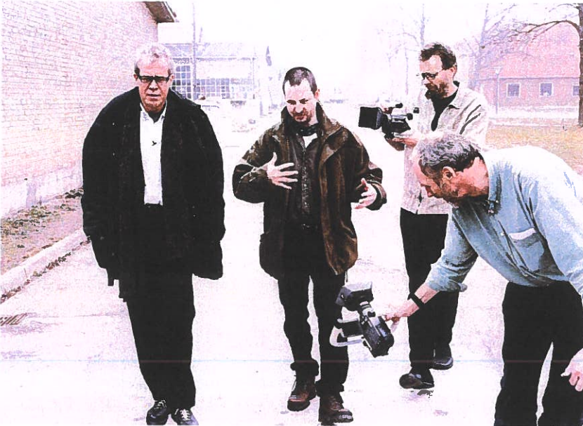
I den reflektive dokumentar De fem benspænd opstiller Lars von Trier regler for, hvordan Jørgen Leth skal lave genindspilninger af Det perfekte menneske fra 1967.

Trier er en stor fan af filmen og sætter Leth i gang med at producere en ny version af den. Denne gang skal Leth imidlertid arbejde efter von Triers helt urimelige og særprægede regler. Filmen leger med filmmediet – det er en film, der handler om sig selv og sin egen tilblivelse! Undervejs bliver publikum opmærksom på, hvordan filmens virkelighed ændrer sig på grund af tilfældigheder og Lars von Triers pludselige indfald.