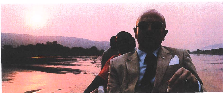
I Ambassadøren fra 2011 optræder dokumentarfilminstruktøren Mads Brügger som forretningsmanden Mr. Cortzen.

Instruktøren Mads Brügger giver sig i dokumentaren ud for at være forretningsmanden Mr. Cortzen. Under påskud af at ville starte en tændstikfabrik, rejser han til Den Centralafrikanske Republik. Publikum følger, hvordan Brügger forvandler sig til den fiktive forretningsmand. Han bliver nu en aktiv del af det der skildres. Mr. Cortzen opsøger forskellige embedsmænd i det afrikanske land. Langsomt, men sikkert, er han med til at skabe den virkelighed, som fremstilles for publikum. Ved hjælp af sit skuespil lykkes det Brügger at afdække magtmisbrug og korrupsion i Afrika. Filmen skabte en del debat i Danmark på grund af sin dokumentariske metode.