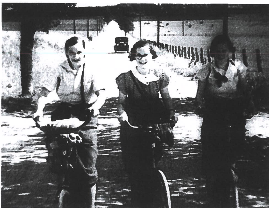
Poul Henningsens Danmark fra 1935 regnes for den første egentlige dokumentarfilm i Danmark.

Poul Henningsens Danmark (1935) indledte traditionen for dokumentarfilm i Danmark. Tidligere danske dokumentarfilm havde i høj grad karakter af "registrering af virkeligheden", hvor filmen blot gengav en konkret begivenhed. Danmark har derimod en klar personlig holdning til sit emne. Med sin fremstilling af nationen levede PH op til definitionen på en dokumentarfilm: "en kreativ behandling af virkeligheden". I filmen koncentrerede han sig om almindelige menneskers liv, væk var dannebrog, kongehus og bølgende kornmarker. Den ligefremme tone i filmen vakte stor forargelse ved premieren. Man mente, at PH nedgjorde Danmark som nation. Filmen blev trukket tilbage og blev først taget til nåde i 1960.