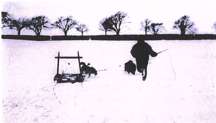
Kørsel med Grønlandske hunde , Peter Elfelt 1897. Filmen foregiver at være optaget på Grønland, men træerne i baggrunden afslører iscenesættelsen.

I Danmark var kongelig hoffotograf Peter Elfelt en af filmpionererne. I Paris havde han set film hos Lumière-brødrene, og hjemme igen optog han filmen Kørsel med grønlandske hunde . En kolonibestyrer fra Grønland var på juleferie i København, og Elfelt filmede ham i Fælledparken, mens han kørte med hundeslæde. Filmen skulle give indtryk af det daglige liv i Grønland, men træerne i baggrunden af billedet afslører den sande location. Filmen regnes for at være den første danske film. I de næste år optog Elfelt en lang række reportagefilm, bl.a. med den kongelige familie og det bedre borgerskab. I 1903 var Peter Elfelt også manden bag Danmarks første spillefilm Henrettelsen .