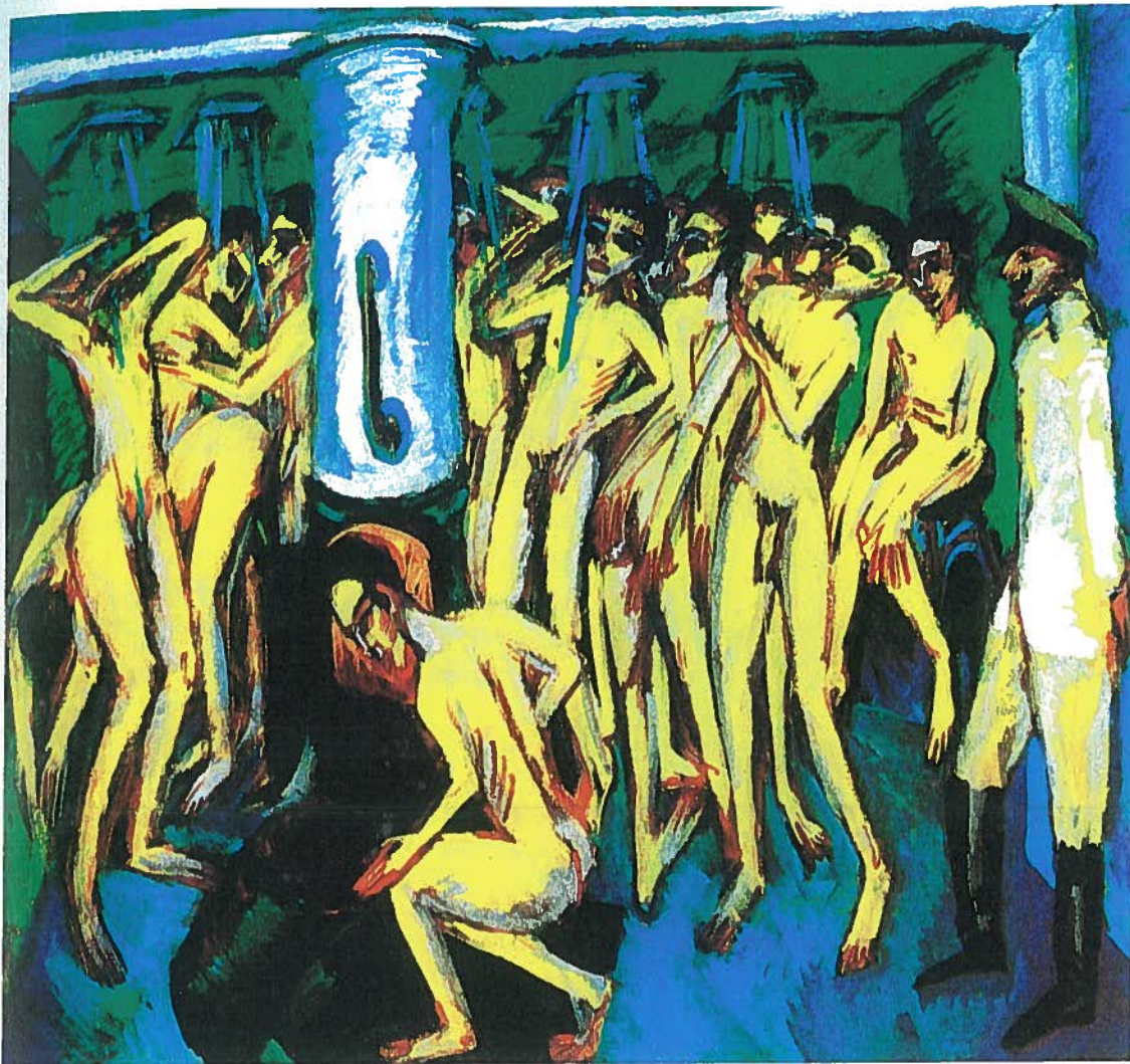
Ernst Ludwig Kirchner: Soldater under bruseren. 1915. Olie på lærred. 140,3 x 150,8 cm. Museum of Modern Art, New York.