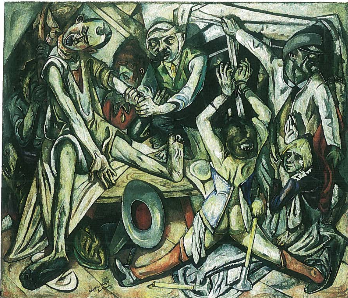
Max Beckmann: Natten. 1918-19. Olie på lærred. 133 x 154 cm. Kunstsammlung Nordrhein-Westfalen, Düsseldorf.

Denne type poesi ville have været utænkelig uden Freud og især uden verdenskrigens drabserfaringer. Den moderne kunstner har ganske rigtigt ikke hovedet fyldt af "elverdans og elskovsdrøm-