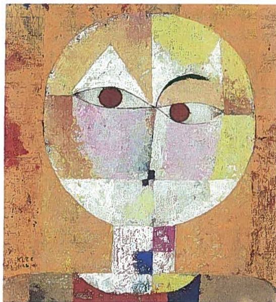
Paul Klee: Senecio. 1922. Olie på lærred. 40,5 x 38 cm. Kunstmuseum, Basel.

Begejstringen for Sovjetunionen, som den nye russiske stat hedder, er især udpræget i intellektuelle kredse, der ud over det politiske budskab i revolutionen lægger mærke til, at den revolutionære kunst er frisk, ny og stærkt eksperimenterende, men dog med et klart formål: den er kunst for folket.