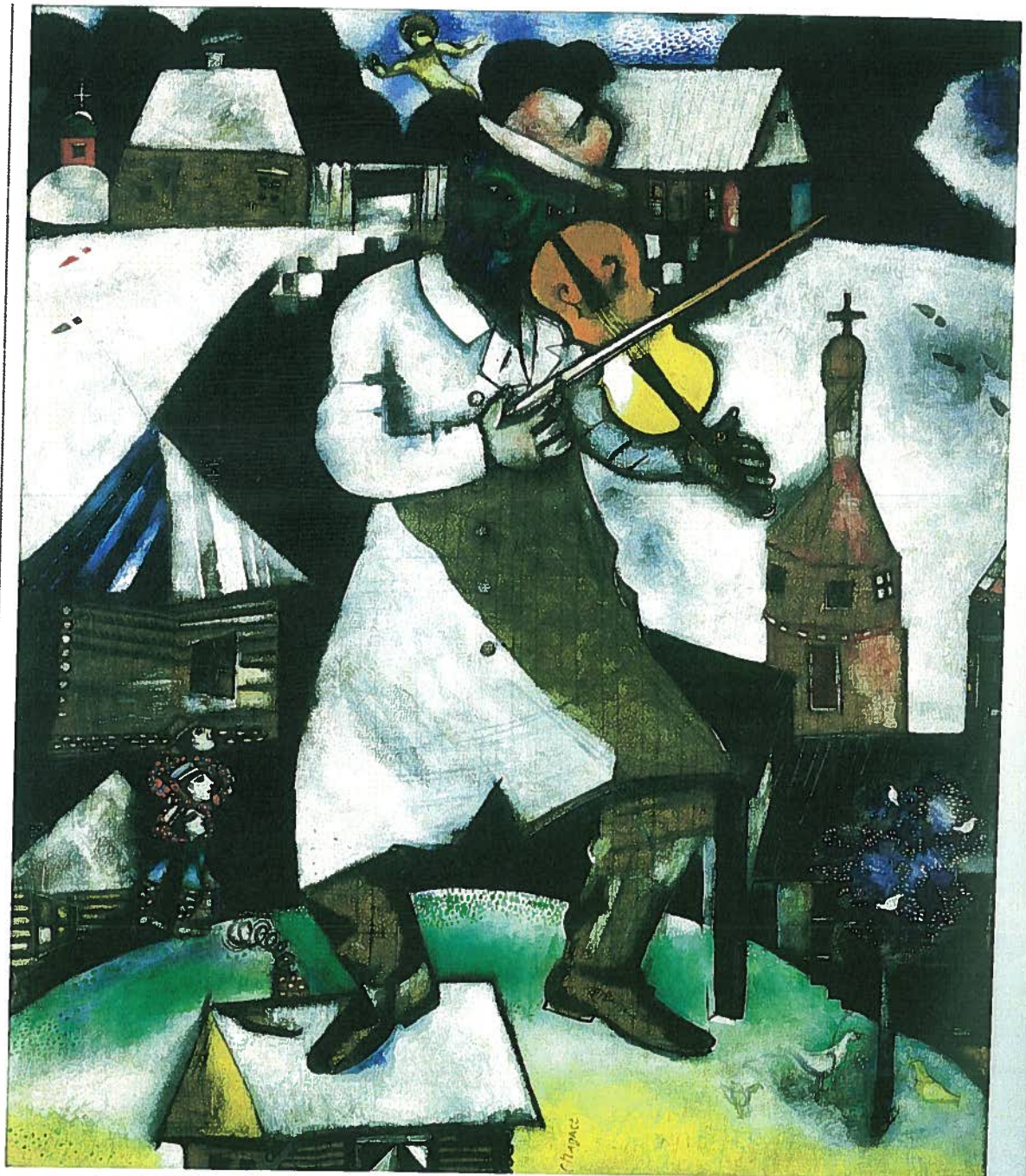
Marc Chagall: Violinspilleren. 1912-13. Olie på lærred. 188 x 158 cm. Stedelijk Museum, Amsterdam.

Digtet er naturligvis et programdigt, men det rummer alligevel en bemærkelsesværdig dobbelt-hed: Dels den åbne nysgerrighed i forhold til virkeligheden ("Er en fribytter ikke en sejler" ... "og vågnende stirrer mod livet"), dels en suveræn myndighed til at skabe verden om i kunstnerens eget subjektive billede ("at slynge sin indre verden ...").