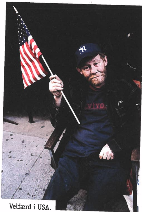
Velfærd i USA.

At model og virkelighed ikke altid går hånd i hånd, kan eksemplificeres ved præsident Obamas indførelse af den så- kaldte Obamacare-plan , der sikrede over 30 millioner amerikanere en sygesikring. En ordning, der ikke kan siges at ligne den idealtypiske model. Overordnet set er der dog ingen tvivl om, at USA's vel- færdsmodel med rette kan kategoriseres som residual.