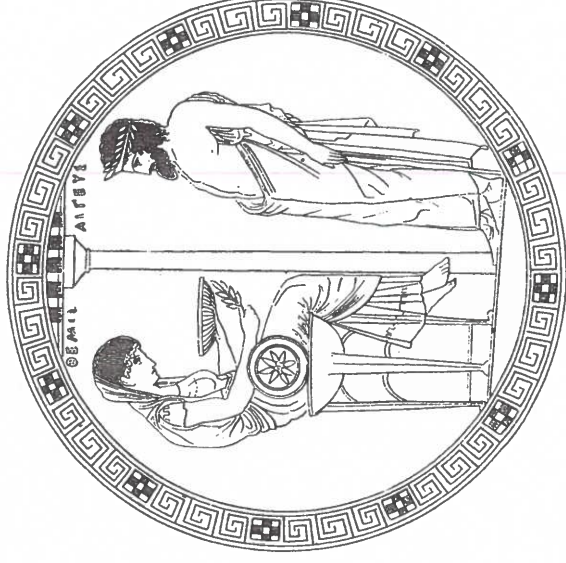
Pythia, Oraklet i Delfi (t.h.). Tegning efter motiv fra en rødfigursvase fra 400-tallet f.v.t.

Temaet er eksplicit hovedtema i Euripedes' Bacchanterne , hvor guden Dionysos vender tilbage til sin hjemby for at