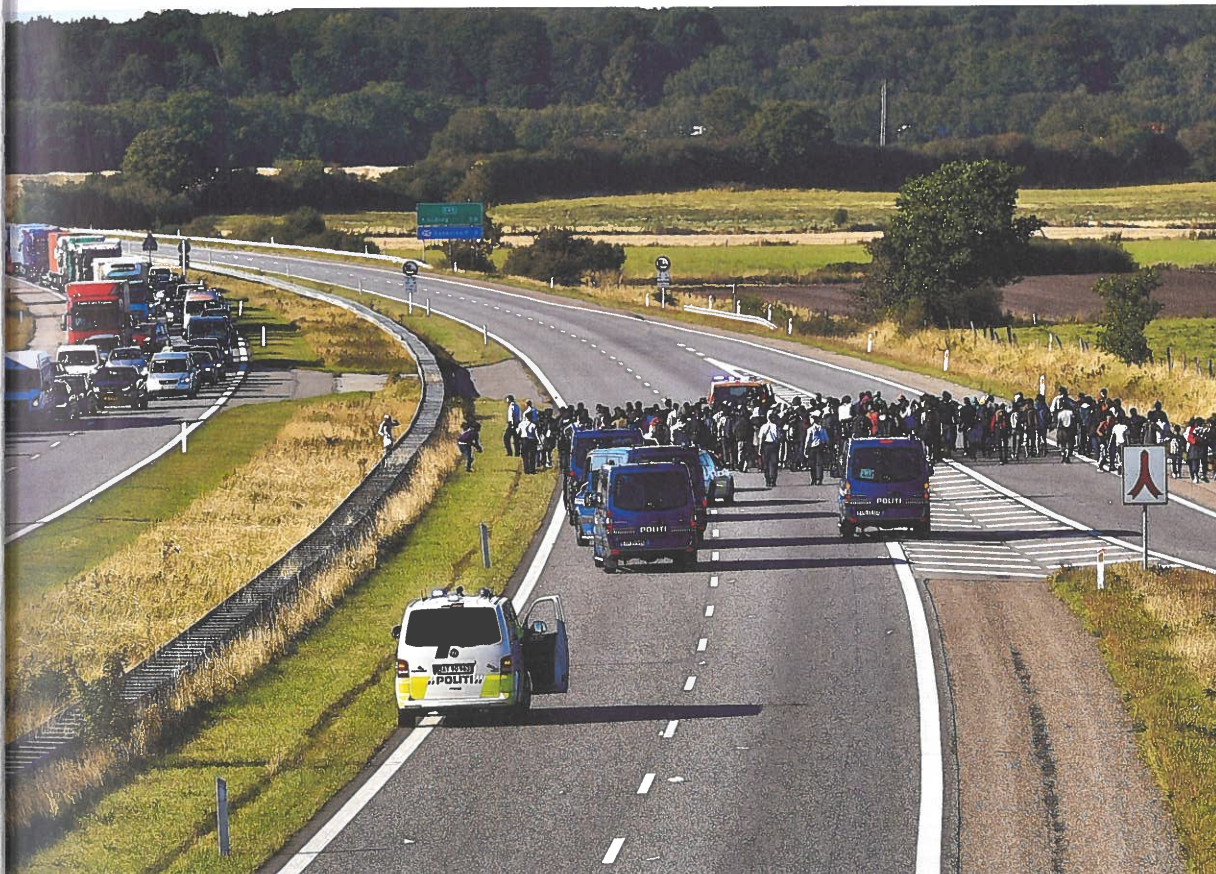
300 flygtningene går på motorvej E45 – her imellem Padborg og Aabenraa. 09-09-2015.

Når man taler om push-faktorer , handler det om, at grupper af mennesker kommer til Danmark, fordi de er „skubbet“ væk fra deres oprindelige land. Man flygter fra noget . Mange af de indvandrere, der er kommet til Danmark, er netop kommet til landet, fordi de har oplevet at blive forfulgt, hvis de for eksempel har en anden politisk holdning eller en anden religion end den herskende gruppe i det land, de flygter fra. Som ofte frygter man for sit liv. Typiske push-faktorer tager dermed udgangspunkt i forskellige former for politisk eller religiøs forfølgelse, undertrykkelse, hungersnød og fattigdom.