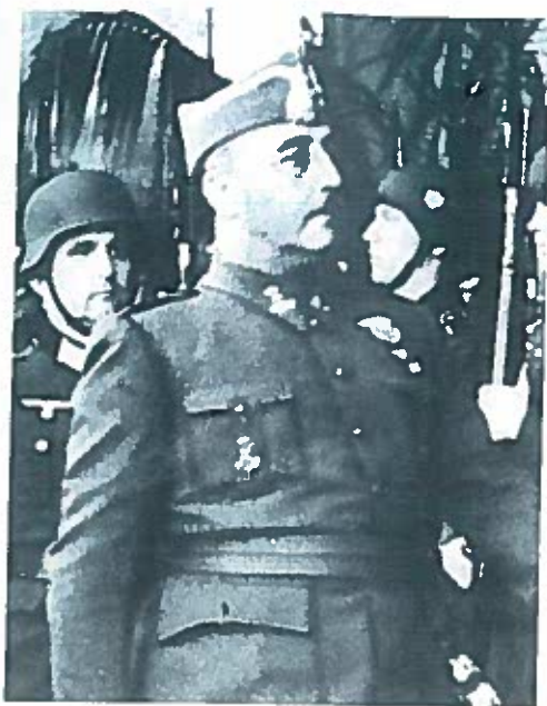
El General Franco

cias a las campañas de solidaridad con la República organizadas en Europa y en América con el apoyo de prestigiosos intelectuales, como por ejemplo Orwell, Hemingway, Neruda y otros. Estas unidades están compuestas por antifascistas de muchos países y de muchas ideologías, mayoritariamente comunistas. Aunque muchos de los "brigadistas" carecen de experiencia militar, luchan en España durante los tres años de guerra y contribuyen eficazmente a la resistencia de la República.