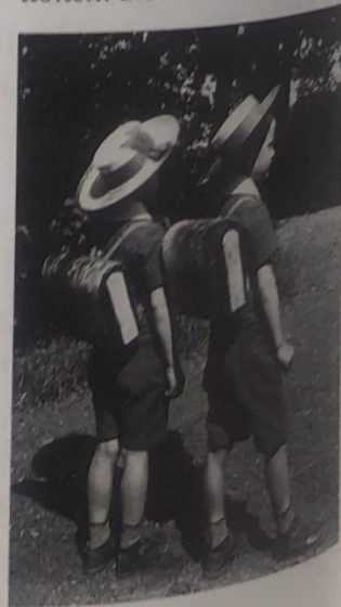
To små nybagte skoledrengene med skoletornyster. Korte bukser og kortærmede bluser hørte sig til indtil konfirmationen. Nakskov, ca. 1910.

I borgerskabet kom den enkelte persons kontrol over sin seksualitet til at spille en central rolle. I bondesamfundet og i de øvrige samfundsklasser i 1800-tallet betød det stadige arbejde sammen med andre mennesker, at der hele tiden var andre, som holdt øje med, at den enkelte ikke sløede tiden væk. Fornøjelser, søvn, sex og lignende aktiviteter blev håndfast holdt inden for bestemte rammer. Borgerskabet måtte