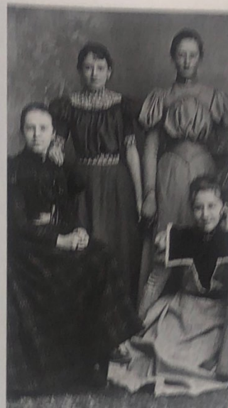
I forhold til mænd var kvinders samværsmuligheder meget begrænsede, men mellem veninder åbnede de strenge moralske konventioner en ventil for lidt kropskontakt, som her hvor piger fra velhavende Nakshov-familier i 1898 viser deres andendagskjoler frem.

Den langsomme omformning til kapitalisme og industriproduktion, gjorde det danske samfund som helhed mere kompliceret. Herved opstod mange mellemfunktioner i administration og forretningsliv, som gav plads for et lag af højere