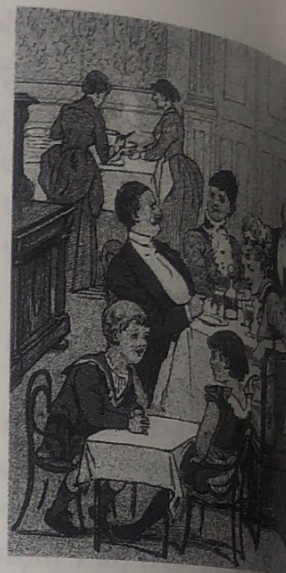
Møbler i barnestørrelse og arrangementer særligt for børn var en del af et nyt syn på barndommen som noget særligt og værdifuldt i sig selv. Tegning i Punch, 1886.

Børnene deltog ikke i det praktiske arbejde i huset. Indtil de kom i skole, var den vigtigste opgave at lære dem at opføre sig artigt. Man opfattede dem som små uskyldige væsener, der ikke kunne være ansvarlige for deres handlinger. De voksne måtte derfor nænsomt forme dem til gode mennesker og samfundsborgere. For at beskytte børnene mod en rå og farlig omverden og for at få indarbejdet rigtige, pæne manerer, skulle der helst være en voksen sammen med dem hele tiden. De fik ikke lov at lege alene på gaden, de måtte lege hjemme eller gå tur med mor eller barnepigen. Som lidt større kunne de besøge andre velhaverbørn og gå til børnebatter. Den ideelle moder fulgte sine børn nøje, blidt og tålmodigt i dagligdagen. Hun irettesatte dem kun nødtigt med smæk og hårde ord – og var det endelig nødvendigt, lod hun ofte faderen