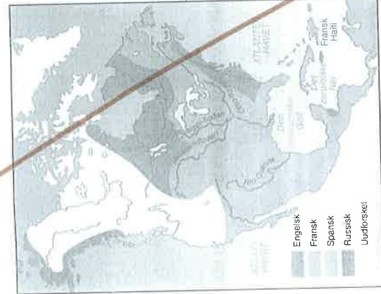
Nordamerika for og efter Englands sejr over Frankrig i Syvårskrigen 1756-1763.