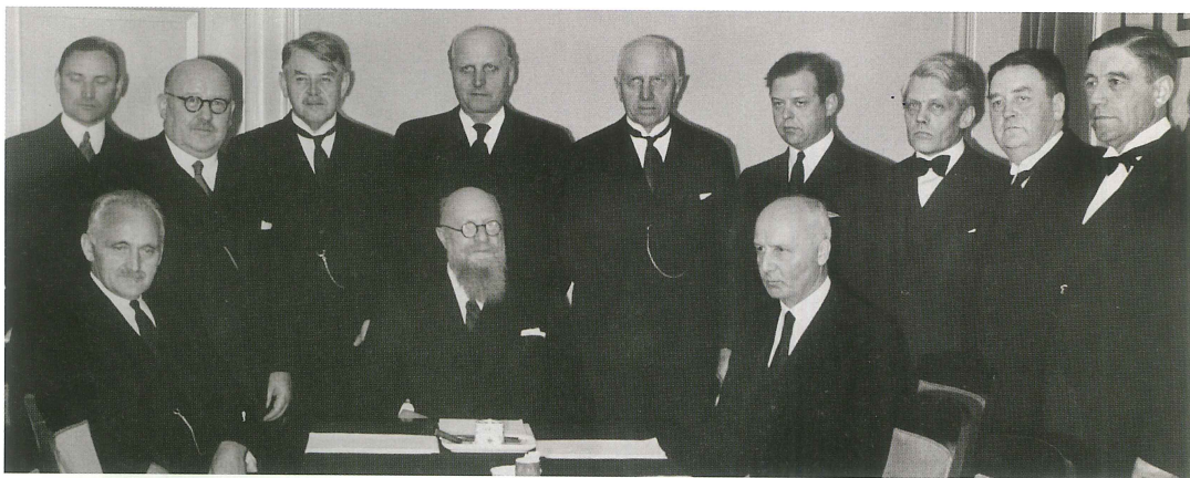
Billede af den samlingsregering, der blev nedsat efter besættelsen 9. april 1940. Regeringen bestod af fire socialdemokrater, en radikal, to venstremænd og to konservative og derudover tre ministre, der stod uden for partierne.

Vidkun Quisling, men som grundlæggende blev styret af den tyske besættelsesmagt.