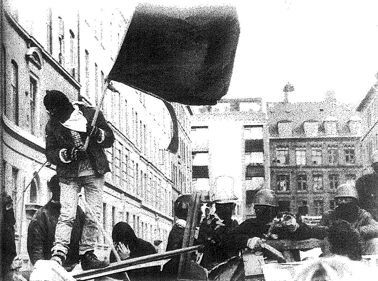
BZ'ere bag en barrikade i Ryesgade i København i 1986