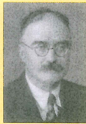
Maurice Halbwachs (1877-1945), fransk sociolog:

Halbwachs sætter tanken på spidsen ved at sige, at vi er narret til at tro, vi har