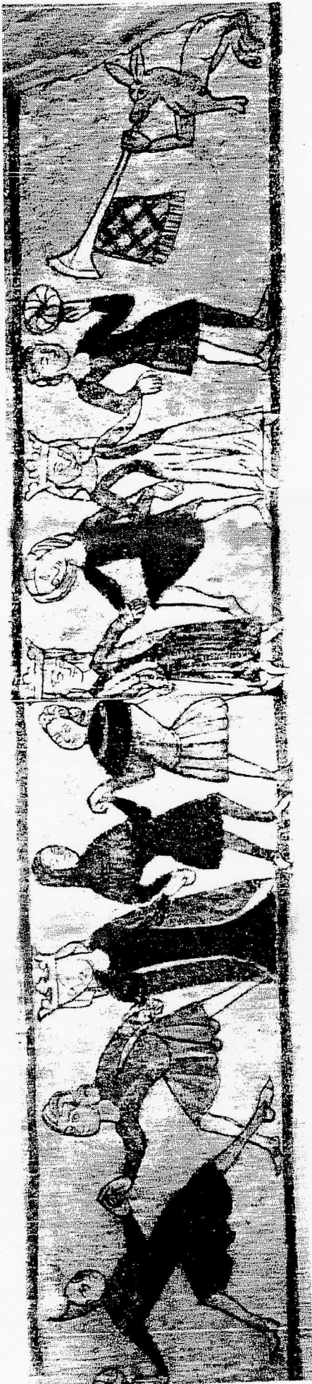
Kædedans, ca. 1325; kalkmaleri, Ørslev kirke