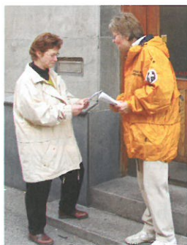
Udover omtale i pressen har mange danskere i årenes løb også mødt scientologer på gaden landet over, hvor de er blevet tilbudt en såkaldt "personlighedstest".

Ifølge Scientologien består mennesket af tre bestanddele: en krop, et sind og en ånd. Eller rettere, mennesket er en ånd (en Thetan ), som eksisterer i en fysisk krop. Hvor kroppen er en forgængelig "kuldioxidmotor" uden intellekt, er både sindet og Thetanen udødelige og har i teorien eksisteret siden tidernes morgen. Thetanen er det, der som udgangspunkt 'styrer' mennesket, det er tanke, vilje og intellekt, og er i forhold til sin grundlæggende natur ubegrænset i al sin handlen og gøren. Med andre ord er der principielt set ingen grænser for, hvad Thetanen kan gøre eller udrette, hvis den er fri til det, ubegrænset af sine engrammer og den fysiske krop; en tilstand, man inden for Scientology beteg-