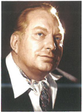
L. Ron Hubbard (1911-1986).

Det var den 9. maj 1950. Dagen, hvor L. Ron Hubbard (1911-86), flådeofficer, filantrop og science fiction-forfatter m.m., udgav bogen Dianetik – Den moderne videnskab om mental sundhed . Men med adskillige både romaner og noveller bag sig var Hubbard ikke uvant med at udgive bøger. Dianetikbogen var dog anderledes. Den var ikke fiktion som hans tidligere bøger, men i stedet en slags 'selvhjælpsbog' til at få et bedre liv. Med udgivelsen af Dianetikbogen var kimen ikke bare lagt til en ny forfatterkarriere, men også til det, der bare i løbet af få årtier er blevet en af de mest udbredte – og omdiskuterede – nye religioner i nyere tid: Scientology.