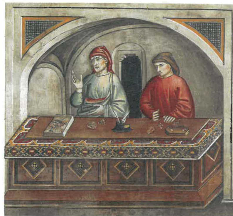
To bankfolk ved deres banco. Her kunne handelsfolk oprette en konto, låne penge og veksle valuta. På bordet ligger penge og en regnskabsbog. Ordet banco blev til banca som oversat til dansk betyder bank. Illustrationen er fra ca. 1395.

der er meget varieret håndværksmæssig og industrilignende produktion i byerne. I mange byer blev uld forarbejdet til klæde, og i byer som Pisa, Genova og Venedig voksede der en glas-, silke- og farvervirksomhed frem. I Firenze opstod først og fremmest en uldindustri af høj kvalitet med mange tusinde ansatte. Den gode kvalitet gjorde det muligt at sælge klædestofferne uden for Italien. De italienske byer udviklede også en egentlig bankvirksomhed. Den tiltagende handel skabte behov for ordnede betalingsforhold, sikre pengeoverførsler og finan-