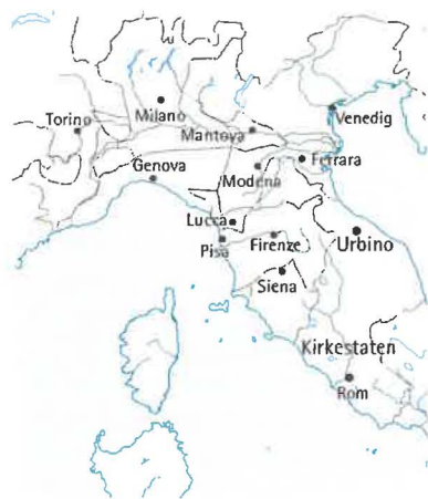
Norditaliens bystater omkring 1450.

af religiøs intolerance og manglende udvikling. Disse århundreder var så at sige en mellemtid – en middelalder – mellem den antikke højkultur og en ny strålende fremtid. De italienske forfattere og lærde i 1300-tallet var meget bevidste om, at de levede i en ny tid. Så optaget var de af at beskrive deres egen tid som en ny fantastisk periode, at de overså de fremskridt, der var sket i middelalderen.