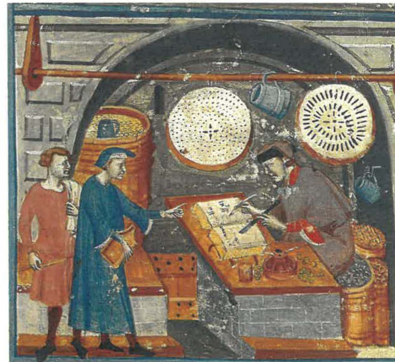
Kornhandler fra 1300-tallets Italien. Han noterer omsætningen i sin regnskabsbog. Samtidig illustration.

Havde man succes, blev det vist ved at gå i den nyeste mode, bygge et fornemt hus og indrette sit hjem efter tidens smag. Den forfængelighed og