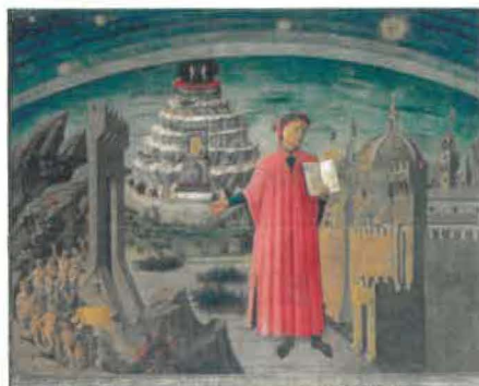
Dante Alighieri (1265–1321) på et maleri fra 1465 af Domenico de Michelino i Domkirken i Firenze. Dante står med "Den guddommelige komedie" i hånden uden for fødebyen Firenze, hvorfra han blev forvist i 1302. Til venstre vandrer de fortabte til Helvede, og i baggrunden rejser sig Skærsildens bjerg. Over det hvælver sig himmelsfærerne.

De tre italienske forfattere Dante Alighieri, Francesco Petrarca og Giovanni Boccaccio fik stor betydning for renæssancen. De stod på flere måder for et litterært nybrud. Alle tre forfattere skrev på italiensk folkesprog og ikke på latin, og det betød, at kendskabet til litteratur blev udbredt til en langt større læserkreds end tidligere. Litteraturen fik dermed sit eget sprog og var ikke længere underlagt kirkens.