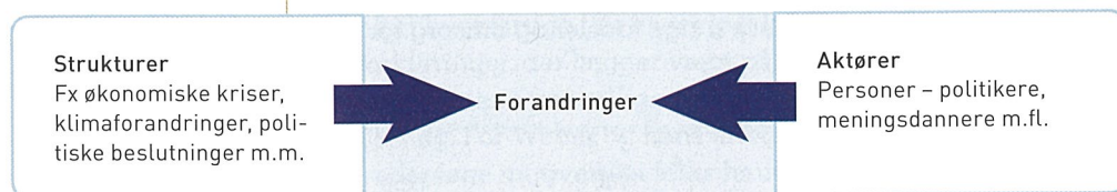
Figur 2.5 Aktør-struktur- dualisme