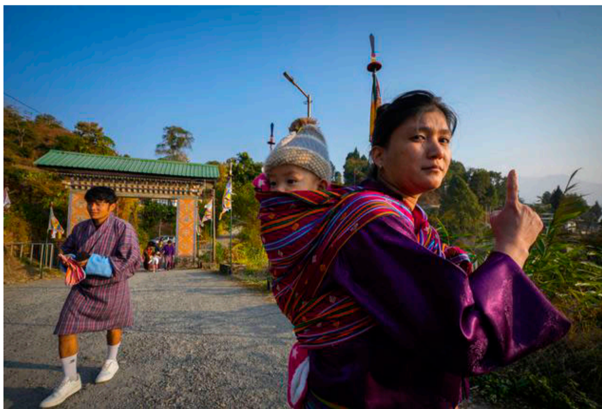
■ En kvinde med barn har lige stemt til valget i Bhutan, 9. januar. Den nye regering vil skabe økonomisk vækst, men uden at gå på kompromis med befolkningens lykke. Landets radikale økonomiske model kan også inspirere Danmark, mener politikere og en ekspert.