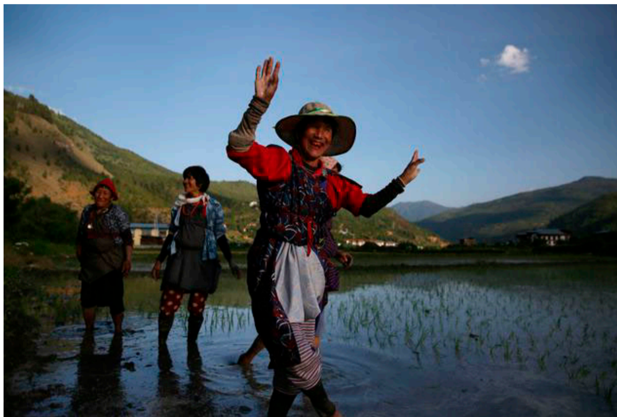
■ Kvinder i marken synger og danser for en god høst. Naturbeskyttelse er en kerneværdi i Bhutans økonomiske model for bruttonationalglæde.