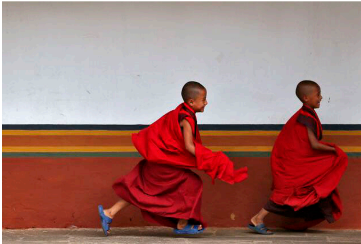
■ Unge munke i Bhutan.

tans tidligere uddannelsesminister, af »den aggressive bnp-hest med skyklapper for øjnene«.