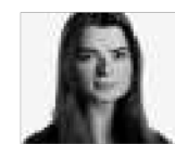
NINA PRATT (TEKST OG FOTO)