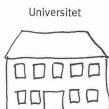
Figur 4.15 Det akademiske felt

duceres. Alle individer råder over nogle forskellige ressourcer/kompetencer. I stedet for ressourcer anvender Bourdieu begrebet kapital, og ifølge Bourdieu råder vi over forskellige former for kapital. Der er den økonomiske kapital, som er økonomisk og materiel velstand (økonomisk kapital = penge).