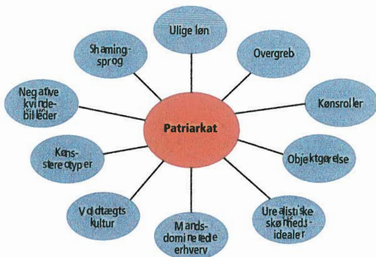
FIGUR. 1.15 PATRIARKATET

Patriarkatbegrebet er også blevet kritiseret fra forskellige sider. Nyere kønsso-ciologer mener, at patriarkat-tanken hviler på en falsk ide om mænd og kvinder som en eviggyldig modsætning, og at teorierne overser homoseksuelle og transkønnede personer, der ikke passer ind i kategorierne 'kvinder' og 'mænd'. Andre mener ikke, at ideen om patriarkatet giver et retvisende billede af kønnenes magtfor-