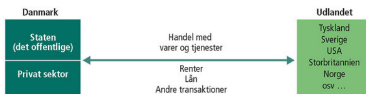
Figur 2.2: Betalingsbalancen

Betalingsbalancen er et regnskab over et lands samlede udgifter i forhold til de samlede indtægter over for udlandet. Der er således tale om både den private og den offentlige sektors samlede udgifter og indtægter i forhold til udlandet i løbet af et år, se figur 2.2.