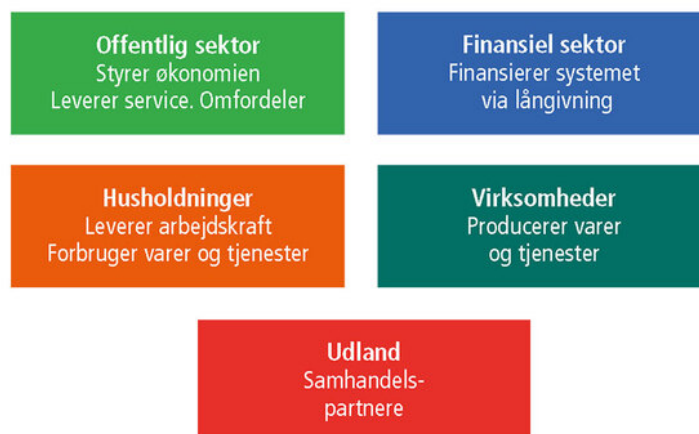
Figur 3.2: De fem aktører i det udvidede økonomiske kredsløb

Det simple økonomiske kredsløb i figur 3.1 er måske lige simpelt nok, for hvor kommer det offentlige, bankernes og udlandets aktiviteter ind i billedet? Derfor har vi i figur 3.2 opstillet de fem vigtigste aktører i samfundsøkonomien og for hver af dem anført deres hovedopgaver. Relationerne (pilene) mellem dem gemmer vi til figur 3.3.