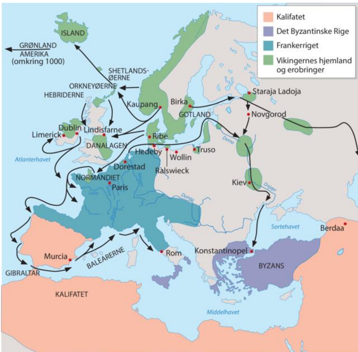
Europa i begyndelsen af 800-tallet med angivelse af de vigtigste nordeuropæiske handelsbyer og ruterne for vikingetogterne.

I 911 tog den danske vikingehøvding, Rollo, imod et tilbud fra den franske konge om at blive hertug over Normandiet i Nordfrankrig. Til gengæld skulle han forsvare riget mod andre vikinger. Mange danske bosatte sig i Normandiet, og Rollo og hans efterkommere skabte et stærkt og velorganiseret hertugdømme. En af disse efterkommere, hertug Vilhelm, erobrede i 1066 England, hvor hans slægt i de følgende århundreder fastholdt kongemagten.