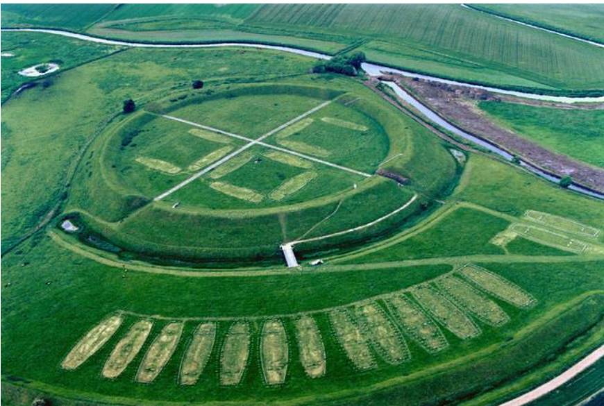
Luftfoto af Trelleborg ved Slagelse.

Det er ikke helt klart, hvad der menes, når der står, at han vandt sig hele Danmark. Måske hentydes der til, at Harald generobrede Hedebyområdet, som en kort årrække var i den tyske kejsers besiddelse, måske har landet til tider været delt i mindre kongedømmer, som Harald har undertvunget. Han måtte til stadighed forsvare sin kongemagt. Selv hans egen søn, Svend Tveskæg, gjorde oprør, og Harald blev besejret og døde af sine sår i 987.