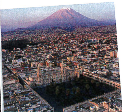
Arequipa blev grund- lagt i 1540 og er Perus andenstørste by

un montón de en masse por todo over hele todavía stadigvæk además derudover indígena oprindelig