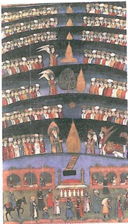
Fig. 14. MUHAMMEDS HIMMELFÆRD På tempelpladsen i Jerusalem stiger Muhammed op i Himlen på en stige. Han er ledsaget af Buraq, men rider ikke på den. I andre traditioner tøjres den på tempelpladsen. I hver himmel lyser en flamme som symbol for profeterne. Indisk bogillustration fra 1808.