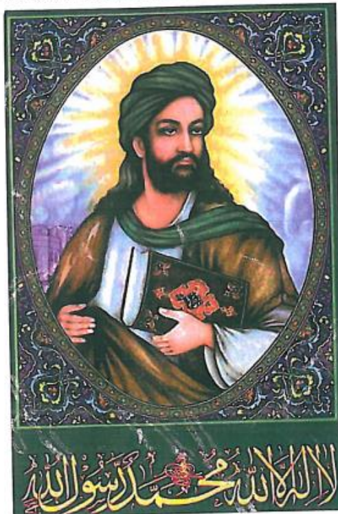
Fig. 15. MUHAMMED I sunni-islam har profetbil- leder altid været sjældne, og me- get få er med genkendelige ansigtstræk. I shia-islam er de derimod almin- delige. Under profetbilledet står trosbeken- delsen. Plakaten er fra Iran 1999.

Åbenbaringerne fortsatte gennem 22 år (610-632 efter den hyppigst anvendte tidsangivelse). Indholdet blev samlet og skrevet ned i Koranen , islams hellige bog.