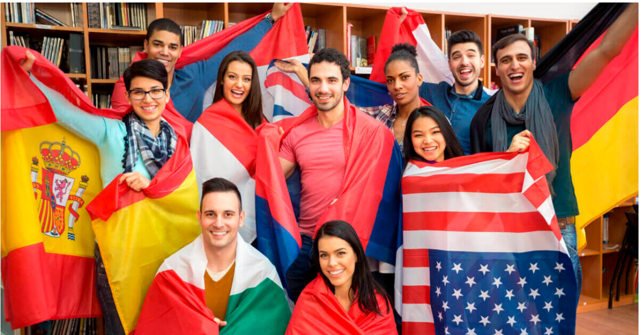
Amigos de intercambio