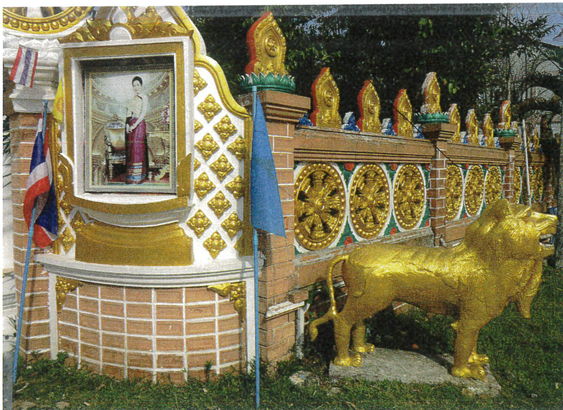
Tempel på den thailandske ø Koh Chang. Muren er udsmykket med den otteleddede vejs hjul og indgangen vogtes af en gylden løve. Muren adskiller Dhammasala-templets område fra den profane verden

Efter sine erkendelser under bodhi-træet udbreder Buddha sin indsigt