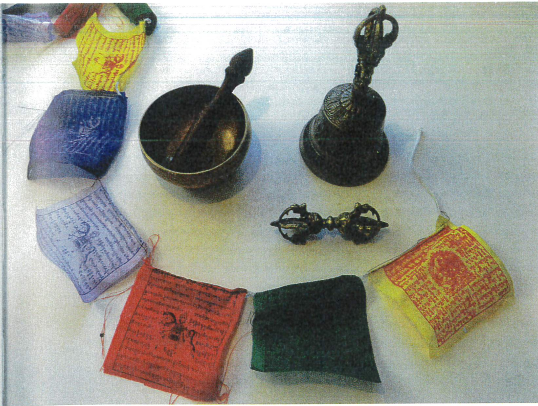
Buddhistiske artefakter til brug i religionsdyrkelsen. Tibetanske bedeflag, bede/synge/tigger-skål, klokke og vajra. De to sidstnævnte holdes i hånden under meditation som udtryk for dualitet og foreningen af modsætninger. Klokken er det feminine aspekt, mens vajraen ('tordenkilen') er det maskuline. Flagene beklæder typisk buddhistiske bygninger. Buddhacitater er trykt på flagene, og når vinden får dem til at blafre, sendes Buddhas ord ud i luften som positiv og lykkebringende kraft, mener man.

Der findes kvindelige munke inden for buddhisme ('bhiksuni'), men almindeligvis forestiller man sig ikke, at en kvinde kan nå nirvana, førend hun er genfødt som mandlig munk. En bhiksuni skal overholde flere regler end mændene, og hun skal forsøge at være så aseksuel som muligt i sit udtryk. Eksempelvis ved at barbere sig skaldet, eller stramme brysterne ind med et stykke stof. En mandlig munk må ikke berøre kvinder, da det forstyrrer og kan vække begær.