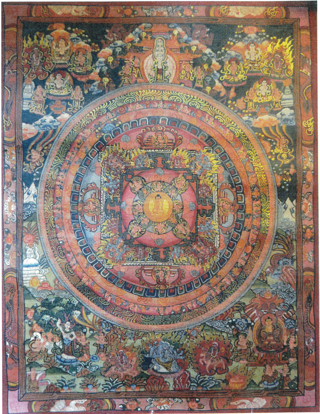
Håndmalet mandala fra Nepal (tantrisk udgave)