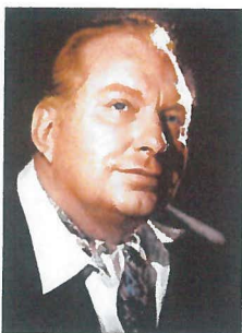
L. Ron Hubbard (1911-1986).

Det var den 9. maj 1950. Dagen, hvor L. Ron Hubbard (1911-86), flådeofficer, filantrop og science fiction-forfatter m.m., udgav bogen Dianetik – Den moderne videnskab om mental sundhed . Men med adskillige både romaner og noveller bag sig var Hubbard ikke uvant med at udgive bøger. Dianetikbogen var dog anderledes. Den var ikke fiktion som hans tidligere bøger, men i stedet en slags 'selvhjælpsbog' til at få et bedre liv. Med udgivelsen af Dianetikbogen var kimen ikke bare lagt til en ny forfatterkarriere, men også til det, der bare i løbet af få årtier er blevet en af de mest udbredte – og omdiskuterede – nye religioner i nyere tid: Scientology.