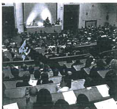
Foredrag i München.