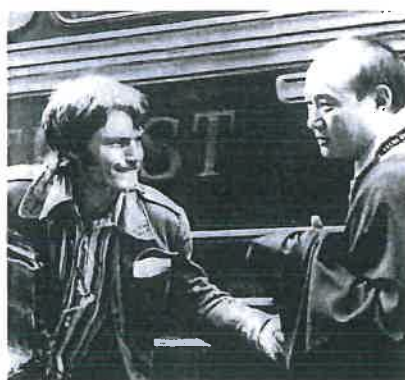
Med His Holiness den 16. Karmapa i 1977.