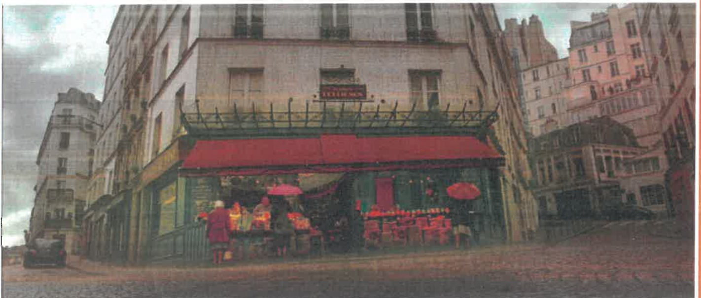
Amélie fait ses courses chez l'épicier Collignon

Grâce à Amélie , Dominique Bretodeau retrouve la petite boîte, pleine de souvenirs de son enfance et cela lui donne envie de voir sa famille, sa fille et son Lucas , qu'il n'a jamais vu . Amélie reconstitue une pour la concierge Madeleine. Elle pense que c'est son mari, son grand amour qui lui écrit et elle pleure de joie . Enfin elle est Georgette et Joseph vont avec l'aide d'Amélie. Amélie vole le nain de jardin pour le laisser avec son amie, Philomène, qui est Quand le nain rentre , le père d'Amélie a soudain envie de voyager et le monde .