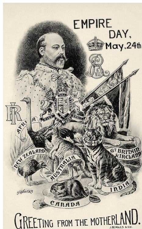
Imperiets Dag den 24. maj. Her kong Edward 7. ca. 1902.

Imperialismen skabte ikke bare rigdom, men også en stærk identitet, og i engelske skoler begyndte man i tidligt i 1900-tallet årligt at fejre 'Imperiets Dag' den 24. maj, den nyligt afdøde dronning Victorias fødselsdag. Tonen i skolebøgerne fik samtidig en mere selvhævdende tone, der indikerede den hvide mands følelse af overlegenhed. Efterhånden blev det tydeligt, at der i briternes syn på sig selv som civilisatorisk magt nu også lå et stærkt element af racisme og en ofte indirekte ringeagtelse af fremmede kulturer og civilisationer. Fremmede folkeslag blev ikke længere skildret som lige for Gud, og engelske skolebørn blev belært om forskelle mellem racer, altid i den hvide mands favør. Indfødte australiere, aboriginere, blev fx karakteriseret som "grimme og med laverestående og beskidte vaner" og som et folk, "der havde mere til fælles med rovdyr end med mennesker" og derfor havde brug for hjælp. Engelsk overherredømme var, måtte man forstå,